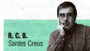
R. C. B. Santes Creus

NEIX PER UNA PREOCUPACIÓ. Neix el 1944, arran de la preocupació per la conservació i restauració del monestir de Santes Creus i de difondre la seva història en ple franquisme