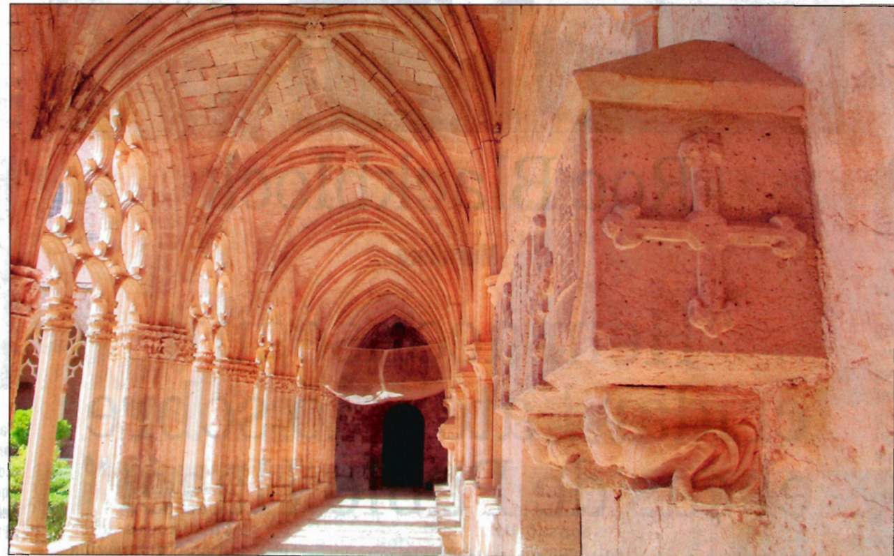
L'entitat treballa des dels seus orígens per difondre el llegat cultural i històric del monestir de Santes Creus.